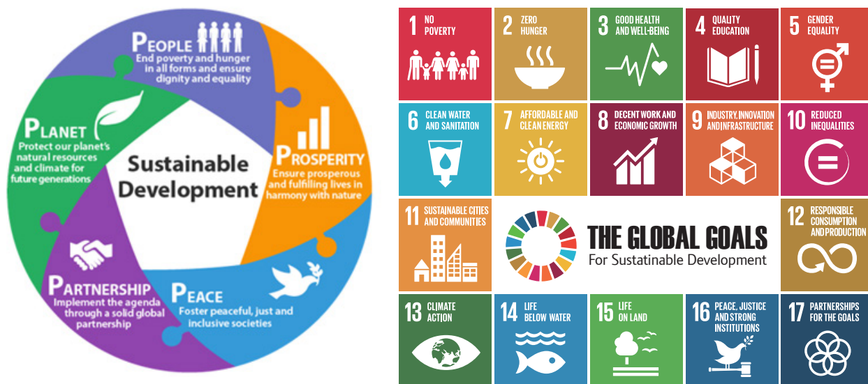
表 1. 2030 年可持续发展议程

全球、区域和国内治理与各地理区域内和各个政策领域间的政治、社会、经济一体化的决策动力和方式息息相关。有效的全球治理安排意味着参与者和执行者之间需保持协调一致。2030年可持续发展议程提供了一个全面的政策框架，旨在以包容与合作的方式实现可持续发展。